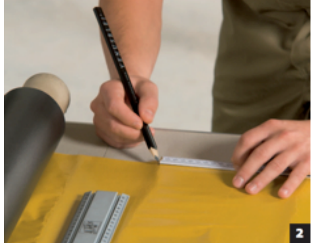
Teken de juiste maat af