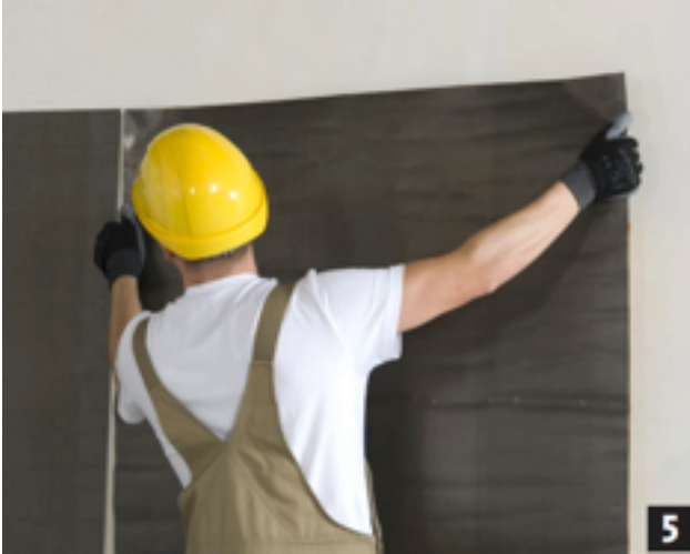
Plak het lood aan de bovenkant vast