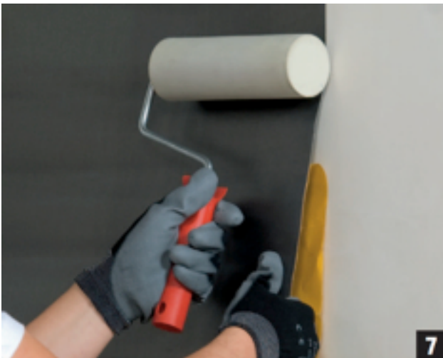
...terwijl u het lood aandrukt