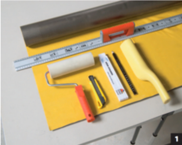
Zorg voor juist gereedschap