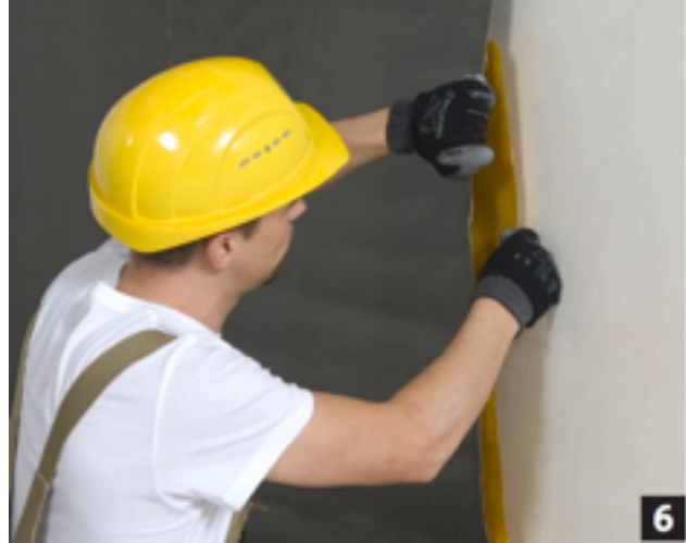
Verwijder langzaam de schutlaag...