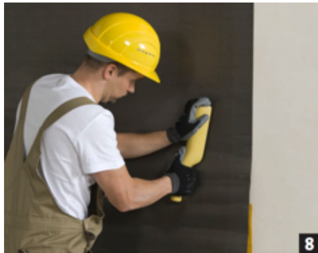
Het loodbehang verder goed aandrukken