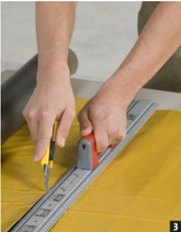
Snijd met een scherp mes het lood af