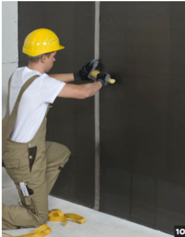
... met zelfklevende loodstroken

Voor technische productbladen, standaard afmetingen en prijzen gaat u naar: www.lood.nu/loodbehang