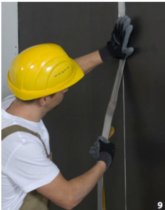
De naden overlappen of overplakken...